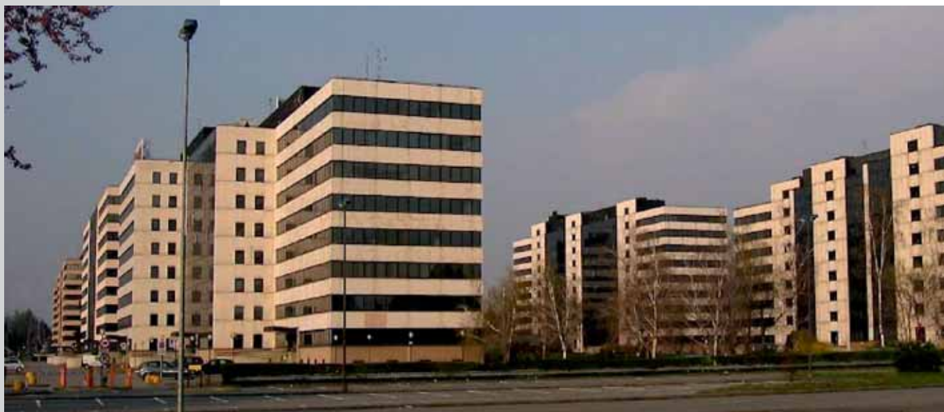
Centro Direzionale Colleoni | Palazzo Pegaso 3